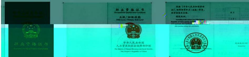
国家职业资格五级（初级）