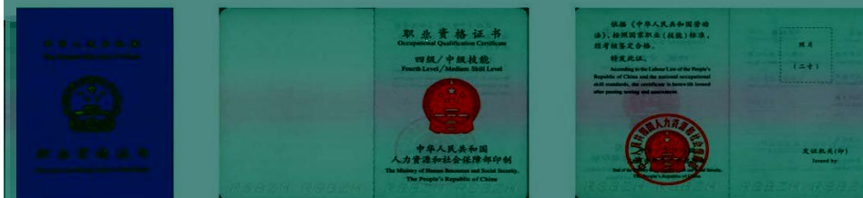
国家职业资格四级（中级）