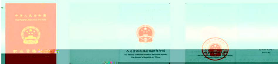
国家职业资格三级（高级）